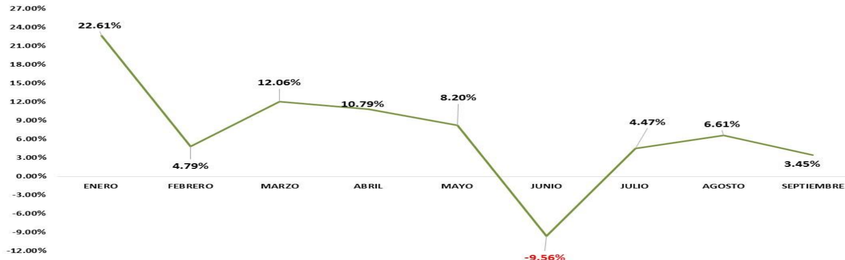
Comportamiento RFP Ene - Sep 17